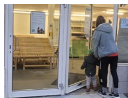
Wir freuen uns auf Sie!

Ab dem 19. November kann jeder bei uns regionale Bio-Produkte von unseren Erzeugerinnen und Erzeugern aus der Region erwerben.