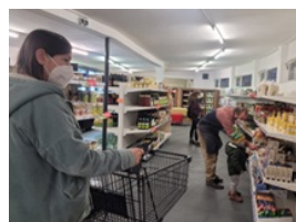
Erste Einkäufe im Laden.

Wir haben gemalert, geschraubt, geputzt und gebastelt. Und mit der Hilfe von so vielen unermüdlichen (ehrenamtlichen!) Händen können wir es nun endlich und voller Stolz verkünden: Radis&Bona öffnet seine Türen.